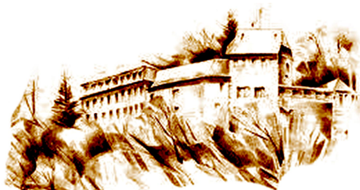
Hotel & Restaurant auf der Creuzburg

Wir freuen uns, Sie als unsere Gäste begrüßen zu dürfen und wünschen Ihnen einen angenehmen Aufenthalt in unserem Haus.